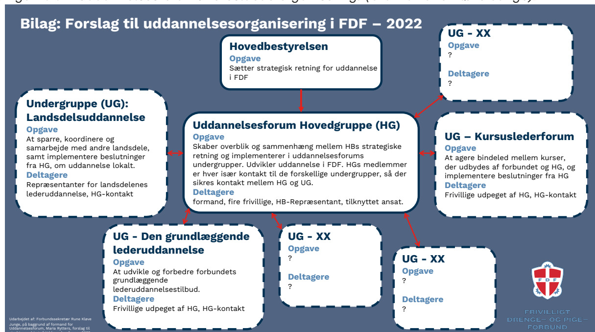
Figur 1.2. – Uddannelsesforums foreslåede organisering. (Grafik: Rune Kløve Junge)