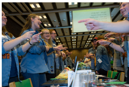
↑ DER VAR GLÆDE HOS UNGDOMSREPRÆSENTANTERNE, DA DET STOD KLART, AT VI HAR FÅET 15ÅRS VALGRET I FDF.

Hovedbestyrelsen ønsker ikke at ændre på ungdomsrepræsentanternes roller. De skal