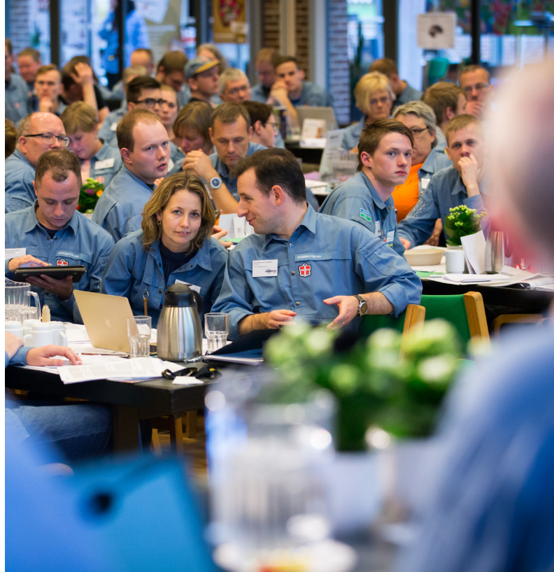
↑ DET VAR EN STUDIETUR TIL EN BØRNE- OG UNGDOMSORGANISATION I BELGIEN, DER HAVDE INSPIRERET HOVEDBESTYRELSEN TIL AT SE PÅ SAMMENHÆNGEN MELLEML IDENTITET OG UDTRYK I FDF.

- Det er et stort problem i FDF, at vi egentlig ikke rigtig ved, hvad vi er. Vi bliver nødt til at starte, hvor vi er i dag: Vi skal spørge den enkelte leder, hvor vedkommende er. Det er på tide at finde ud af, hvem vi vil