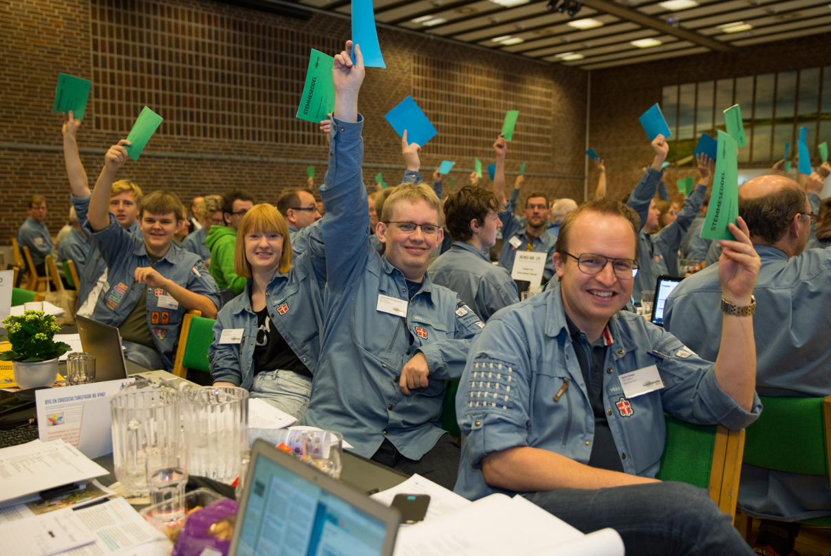
← STEMMESEDLERNE BLEV LUFTET FLITTIGT I LØBET AF WEEKENDEN.