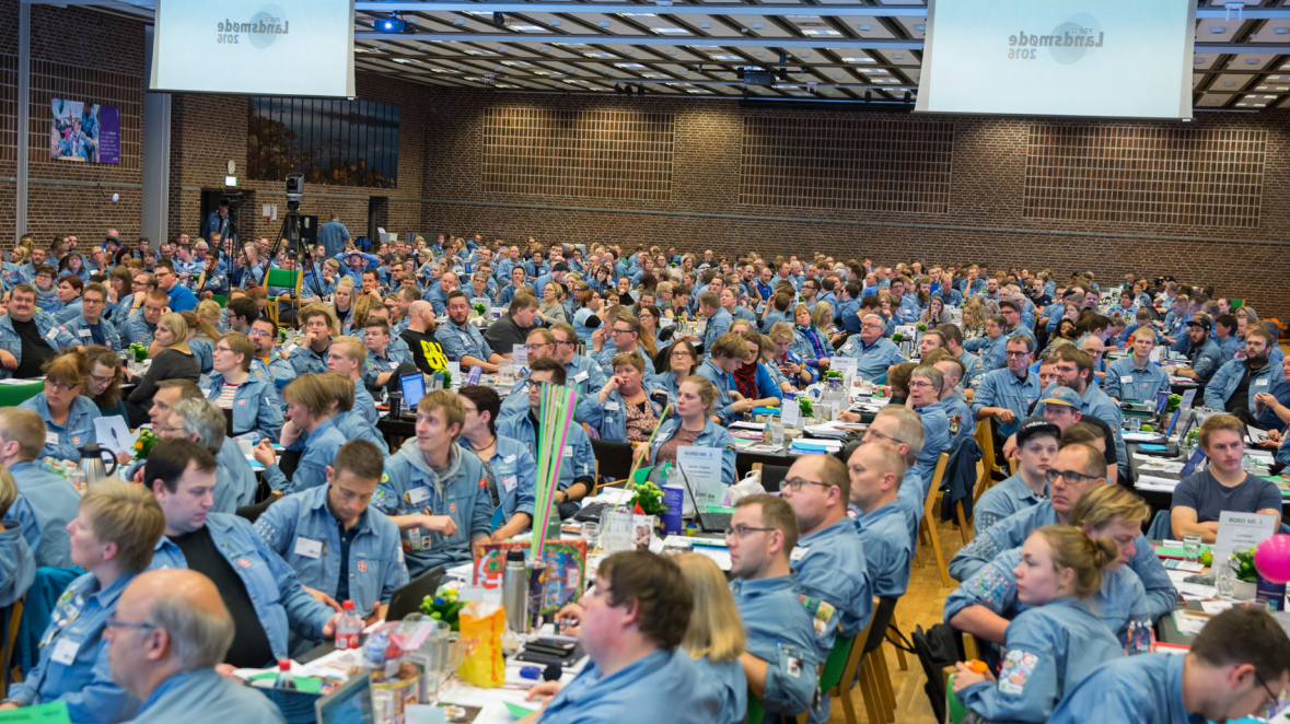
← DER VAR STOR OPBAKNING TIL NYE VÆRDIER I I LANDS- MØDESALEN, DA DE BLEV VEDTAGET LØRDAG.