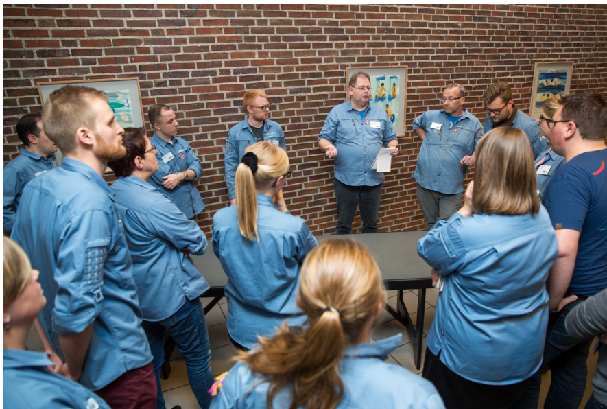
↑ DER BLEV ARBEJDET INTENST PÅ GANGEN UDENFOR MØDESALEN, DA LANDSDELSLEDELSENE FØRSØGTE AT NÅ TIL ENIGHED OM ET SAMLET FORSLAG OMKRING VALG TIL LANDSDELENE.

Landsdel 5, 7 og 8s fælles forslag blev, at landsdelsledelsen består af 5-7 medlemmer,