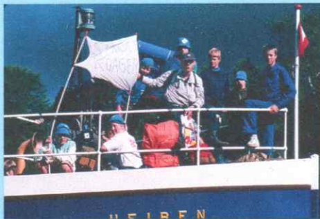
Vandring til lejren.