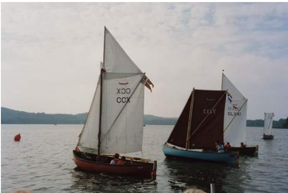
Fra sejladsen om Meginbowlen.