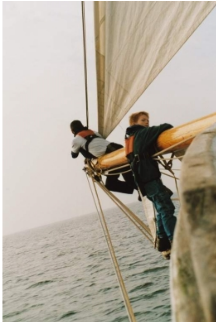
Der er udfordringer i FDFs sejladsarbejde!