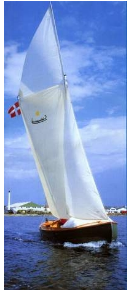
Stormegin no. 1.

Stormegin er en forstørrelse af de små meginjoller. Den har bevaret de samme fordele: hurtigsejlende, stabil, trailbar – men hertil kommer påhængsmotor, sprayhood og cockpittelt, så det er muligt at overnatte ombord.