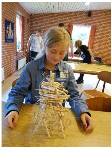
Billede fra aktivdag i Vester Hornum – reb og rafter gruppe.

Der har også været en artikel på fdf.dk om den online piltedag, som kan læses her: https://fdf.dk/nyheder/kendte-arrangementer-i-nye-klaeder