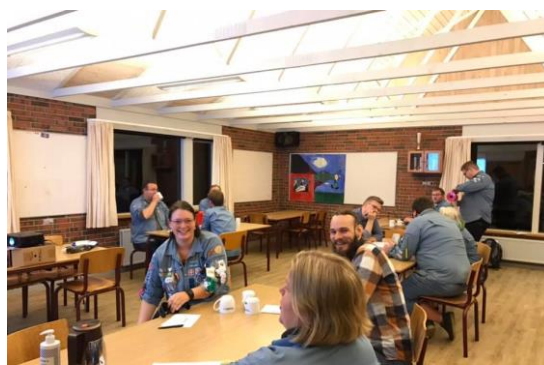
Billede fra udvalgssparringsaften oktober 2020.

I oktober var en stor del af udvalgene samlet til en sparringsaften, hvor fokus var udvalgenes opgaver, udvalgssammensætning samt motivation og rekruttering af udvalgsmedlemmer.