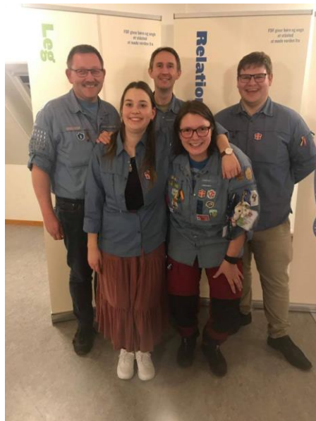
Billede fra landsdelsmøde 2019.