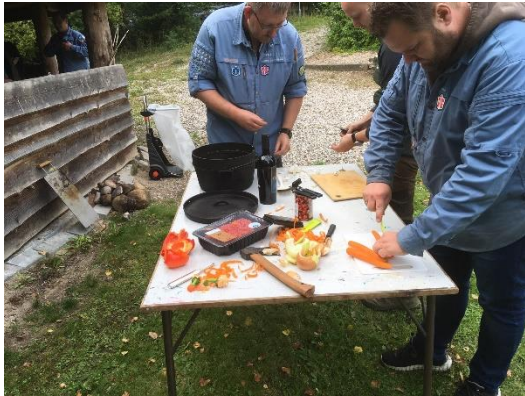
Billede fra "Ildsjæle inviterer til mad på bål"