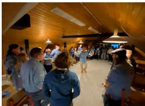
Billede fra lederlounge.

Landsdelsdøgn (lederuddannelsesdag) blev i marts 2020 igen afholdt på Skrødstrup Efterskole. LUDU er også repræsenteret i landsforbundets uddannelsesforum.