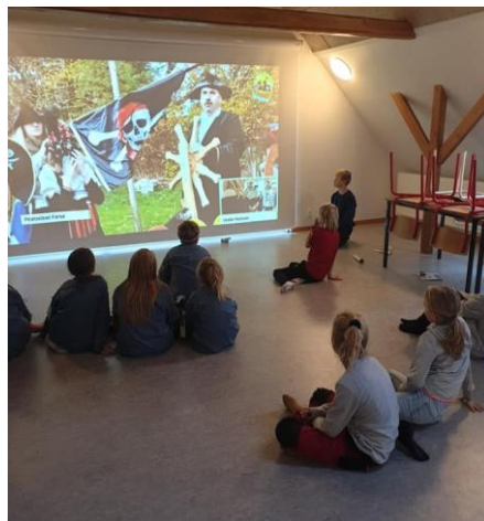
Billede fra online piltedag 2020 FDF Ørum.

4 af kredsene deltog som reportagekredse, hvor der fra tid til anden blev streamet direkte fra de 4 kredse, så piltene kunne se der var andre pilte i landsdelen som udførte samme aktiviteter som dem selv.