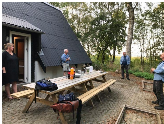
Billede fra netværksmøde i Viborg Netværk – med afstand.

Landsdelsledelsen mødes ca. en gang om måneden – og det er blevet til 13 møder i perioden mellem landsdelsmødet 2019 og landsdelsmødet 2020.