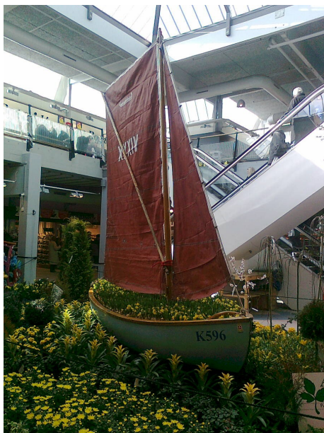
Røskva udstillet i Sct. Mathias Centret