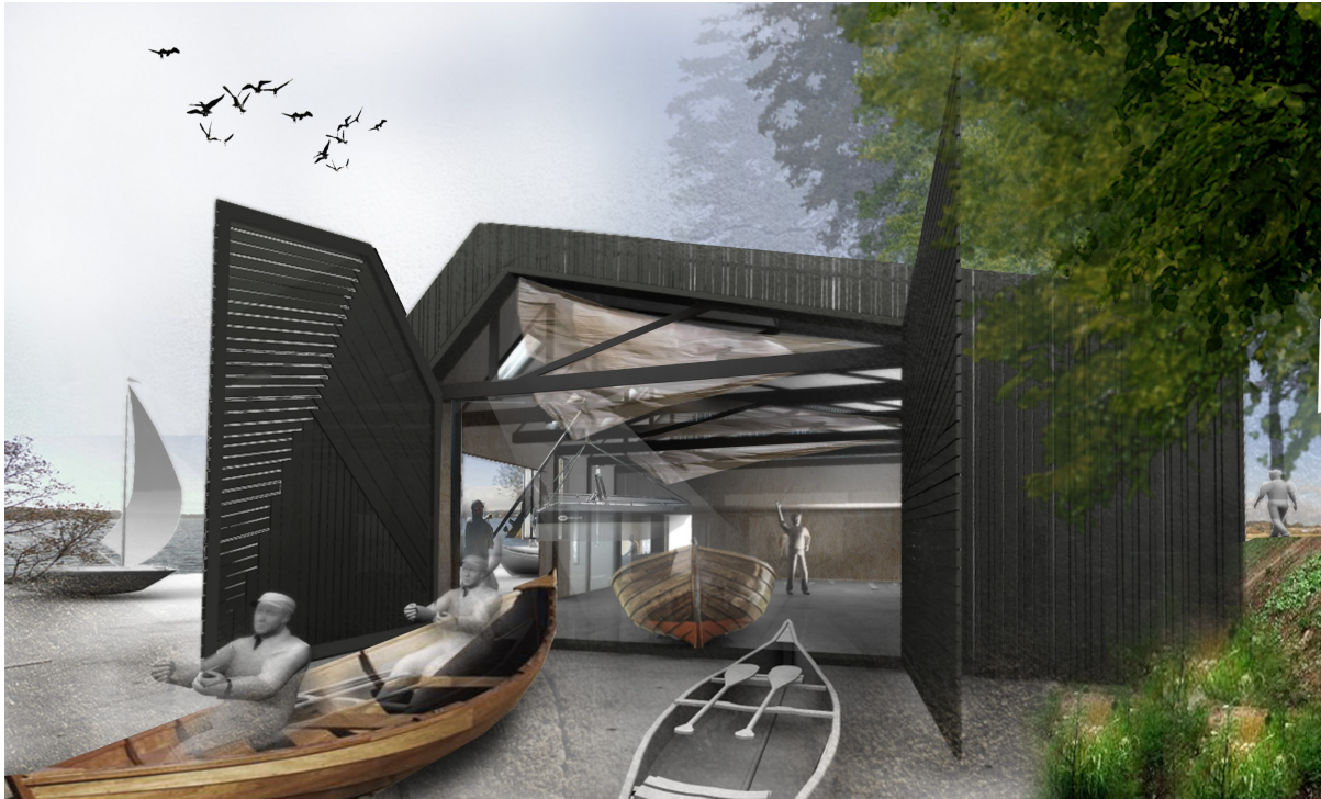
Visualisering af skitseprojektet til nyt "Søens Hus" ved Sejlcenteret

slaget fra Stefan Gustin, samt at lave et forslag til driftsbudget. Inden pressen informeres indkaldes formænd, kasserer og kredsledere i ejerkredsene omkring Sejlads til møde om projektet. I forvejen har kredslederne besluttet, at Viborg 1. kreds har skrevet under på lejekontrakten på jorden med kommunen. Det bør derfor overvejes, om det ikke også bør være 1. kreds, der fremover kommer til at stå som ejer af Sejlcenterbygningen, og FDF Sejlcenter Viborg lejer sig ind her - dels af praktiske hensyn (kommunale tilskud) og dels for ikke at alle kredse kommer til at stå med en solidarisk hæftelse i forhold til bygningen.