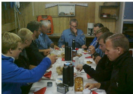
Ledermøde på Sejlcenteret

19. august: Lederaften i FDF Viborg Netværk. Ti ledere fra FDF Overlund og FDF 1. kreds mødt til sejlads i Tjalfe, Røskva og Ørnen. Sol med vind fra S 1-3 m/sek. Herefter kaffe på Sejlcenteret. Røskva var søsat samme eftermiddag, så for første gang i denne sæson var alle tre meginjoller på Flådebasen sidst på aftenen.