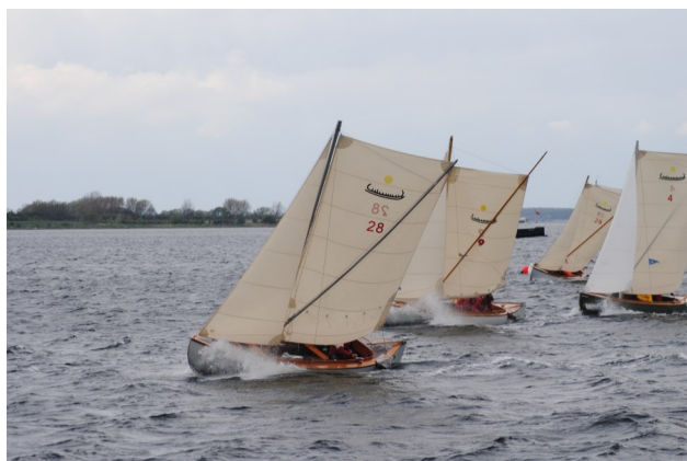
Kapsejlad fra Strynø til Marstal