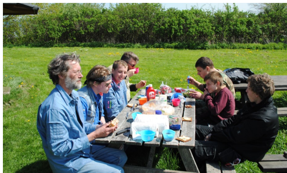
Frokost på Strynø under Stor Megin Stævnet