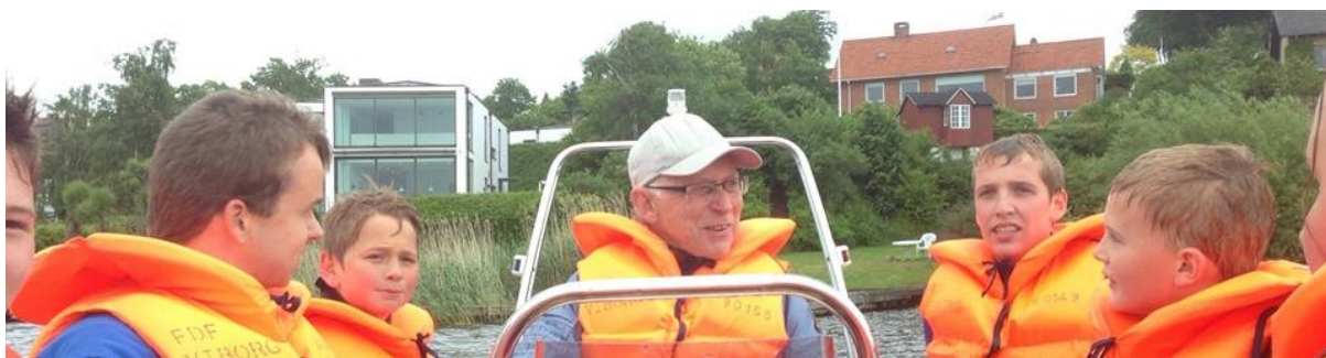
Gaster om bord på Ørnen under redningsøvelse på Nørresø

Trailerne er løbende vedligeholdet og holdes alle i køreklar stand. Der er trailere til hvert enkelt fartøj, så alt kan transporteres samtidig. Øvrigt udstyr (telte, fendere m.v.) er generelt i god stand.