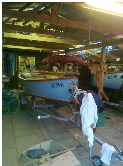
Røskva og Ella under klargøring

9. maj: Otte deltagerne til Stor Megin Stævnet ved Marstal mødtes ved Sejlcenteret om morgene. Herfra gik det sydpå mod Svendborg med Freja og Ørnen på slæb. Søsætning i Rantzausminde Havn. Herfra sejledes til Marstal.