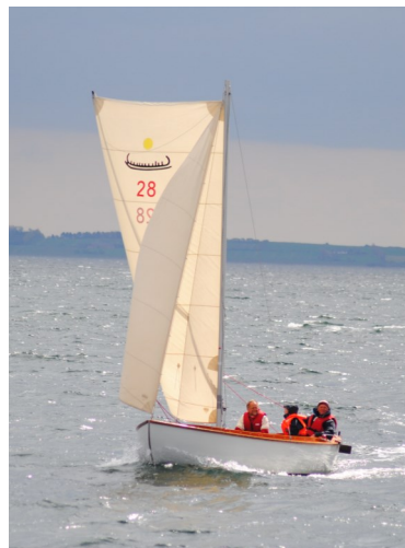
Stor Megin ved Strynø