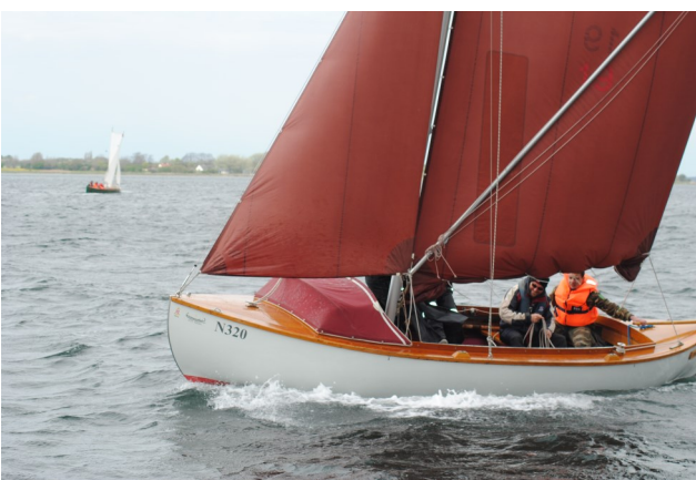
Freja ud for Strynø