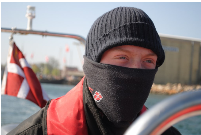
Bo ved roret på Ørnen ud for Marstal Havn

10. maj: I flot vejr og med 8 m/sek. fra SV var der tursejlad til Strynø. Efter nogle timers ophold her var der kapsejlad retur til Marstal. Om aftenen besøgte på skonnerten, Bonavista, som efter flere år ligger restaureret i havnen.