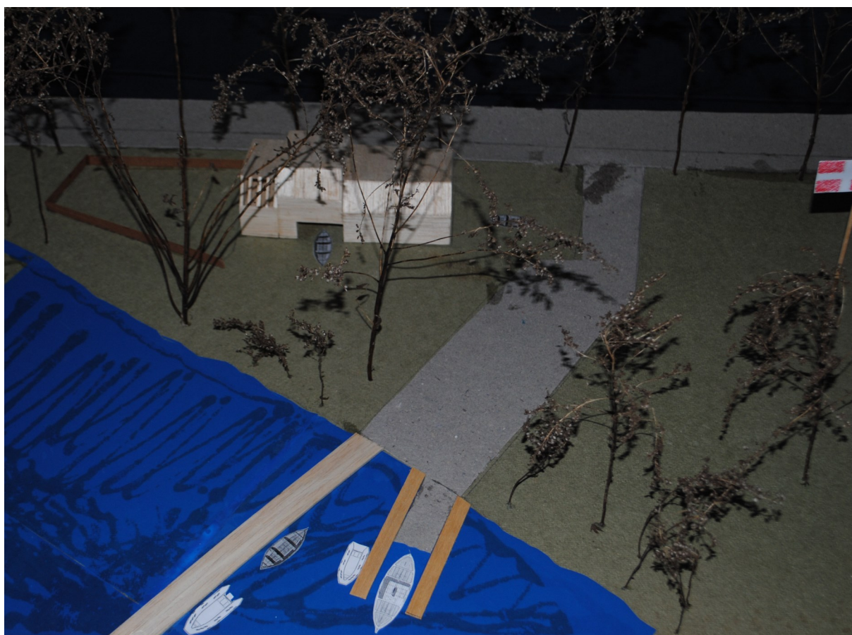
Model af planerne for udbygning af Sejlcenteret