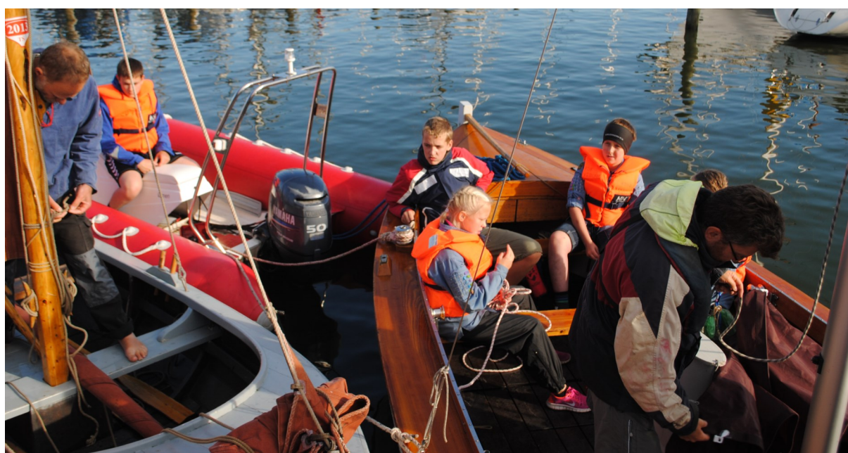
Klargøring til sejlads under VM for Sjægtter