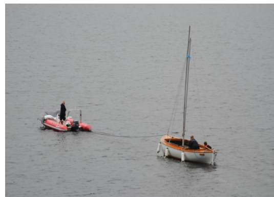
Ørnen og Freja på vej over Nørresø

7. - 13. juli: Ella, Røskva, Freja og Ørnen på Møgelø, hvor FDF Viborg 1. kreds have kredslejr. Temaet for lejrdelen på Juulsborg for piltene var Sø-røverlejr. Her gjorde megin-jollerne god fyldest ved bl. a. "Søslag", hvor to meginjoller udrustet med sørøvere og skumbolde forsøger at skyde hinanden "våde". Bolde, der havner i vandet, må samles op af svømmende sørøvere og enten kastes tilbage til eget fartøj, eller kastes direkte mod fjenden. Den besætning, der bliver mest våd, eller må tage mod flest træffere, taber! Aktiviteten var meget populær på årets Møgelølejr, som afvikledes med perfekt sommervejr alle dagene.