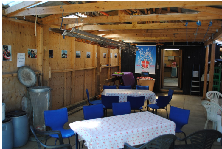
Opstilling af borde i Bådhallen til 25. års jubilæet

Vejret var solrigt med vind fra vest 1-2 m/sek. Til sejladserne benyttedes Ørnen, Freja og Røskva. Vellykket arrangement.