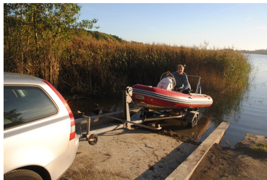
Høgen søsættes som første fartøj på rampen