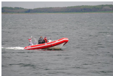
Ørnen på følgebådssejlad ved Strynø

Farvande: Søer, fjorde, og kystnære områder. Fartøjer: Ørnen - Brig, Falcon 500, 50 HK Høgen - Proteus 360, 15 HK Personer: Max.9+5 Mobilitet: To bådtrailere Udstyr: Skipperkasser, VHF, GPS m.v. Flådebase: Nørresøvej 11