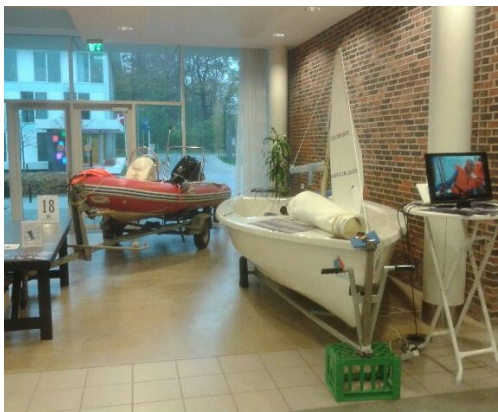
SCL og SCV udstilling på Landsmødet.