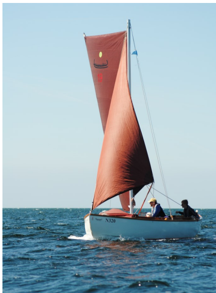
Freja for fulde sejl på vej til Strynø