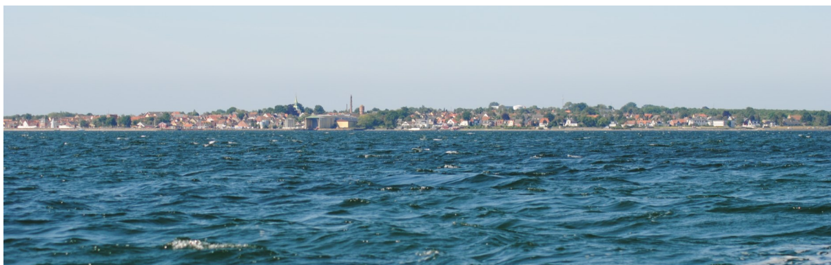
Marstal set fra søsiden