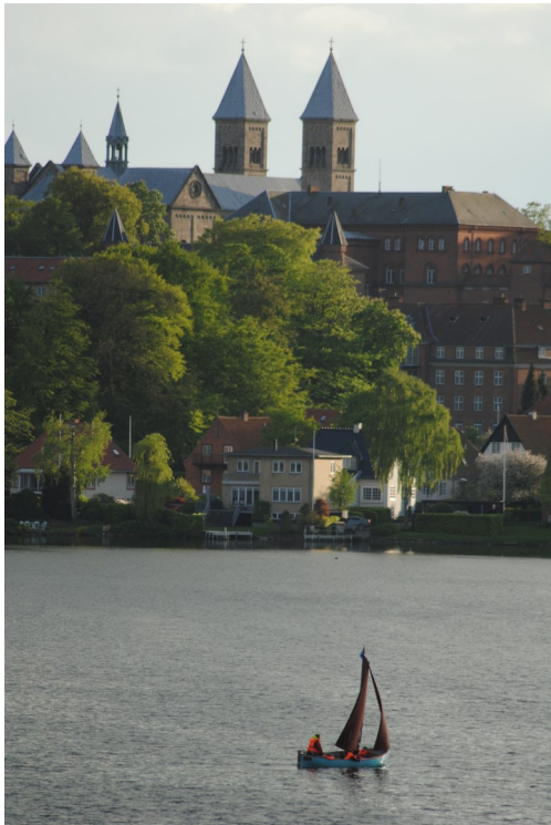
Udsigt fra Kommandobroen på Flådebasen

Torsdag den 8. maj: Om eftermiddagen møde i Sejlcenter arbejdsgruppen. Beslutninger taget omkring igangsætning af slæbested og bro. Desuden undersøges flydeponton som bølgebryder. Delene etableres via tilskud fra Viborg Kommune, Friluftsrådet og evt. Julsfondens, som netop har bevilliget et lån på kr. 150.000,-.