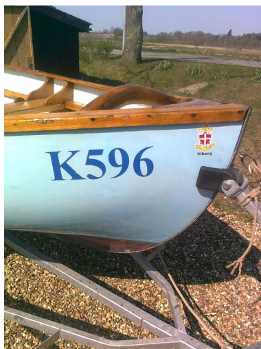
Røskva klar til søsætning

Slibning og D2 på Ella, Forberedte stolpe i bådehus, så den kan bortfjernes, mens der ranges med joller i huset og genmonteres, når huset skal rumme kanoer om sommeren og tage snetryk om vinteren.