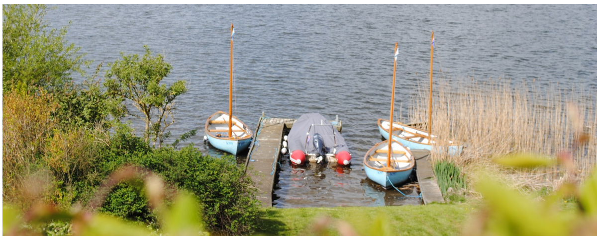
Flådebasen klar med meginjoller og Ørnen

Ved ledermødet bagefter med ni deltagere blev orienteret om, at Friluftsrådet netop har bevilget kr. 197.500,- til "Projekt Sejlcenter".