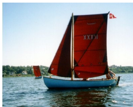
To meginjoller på Nørresø . Foto Flemming Pedersen

Farvande: Søer, fjorde og kystnære områder. Fartøjer: En Stormegin: Freja 19. Tre Megin joller: Ella 33, Røskva 34, Tjalfe 35. To Columbus joller Personer: Max. 24 Mobilitet: Fire bådtrailere, Udstyr: Skipperkasser, Walkies, GPS m.v. Flådebase: Nørresøvej 11