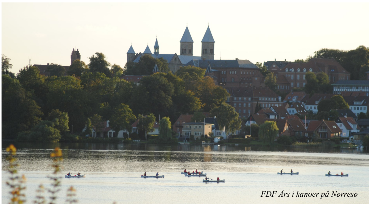
FDF Års i kanoer på Nørresø