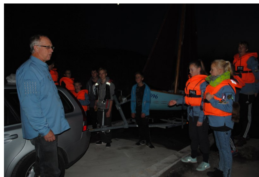
Indvielse af rampen via optagelse af Røskva.