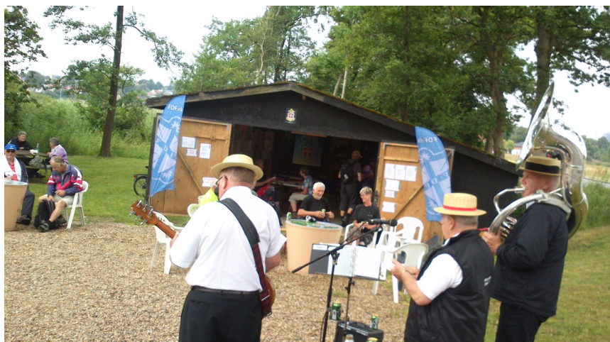
Gamle FDFFere fra Ålborg sørger for musik på rastepladsen

FDFFere) fra Ålborg. Vurderet ca. 600 besøgende på rastepladsen.