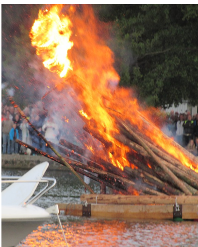
Sct. Hansbål på Borgvold