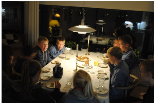
Så er der forfriskning på Flådebasen