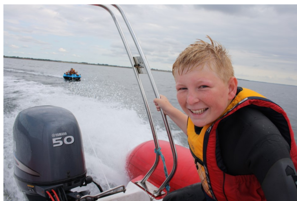
Zander under vandgang på sommertogtet.