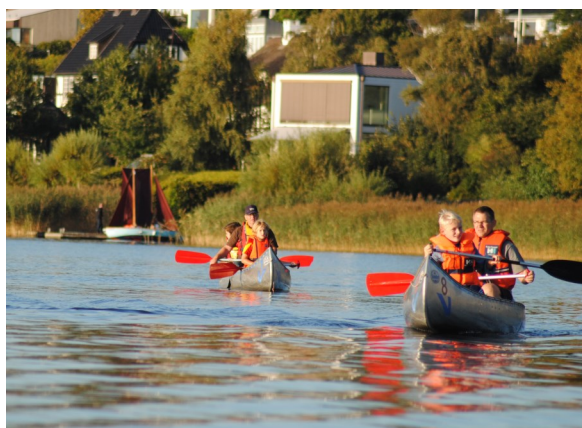
Kanoer ved Flådebasen