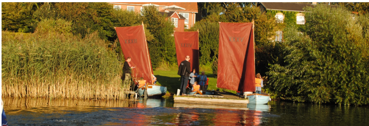
Torsdagssejlads fra Flådebasen

Trailerne er løbende vedligeholdt og holdes alle i køreklar stand. Der er trailere til hvert enkelt fartøj, så alt kan transporteres samtidig.