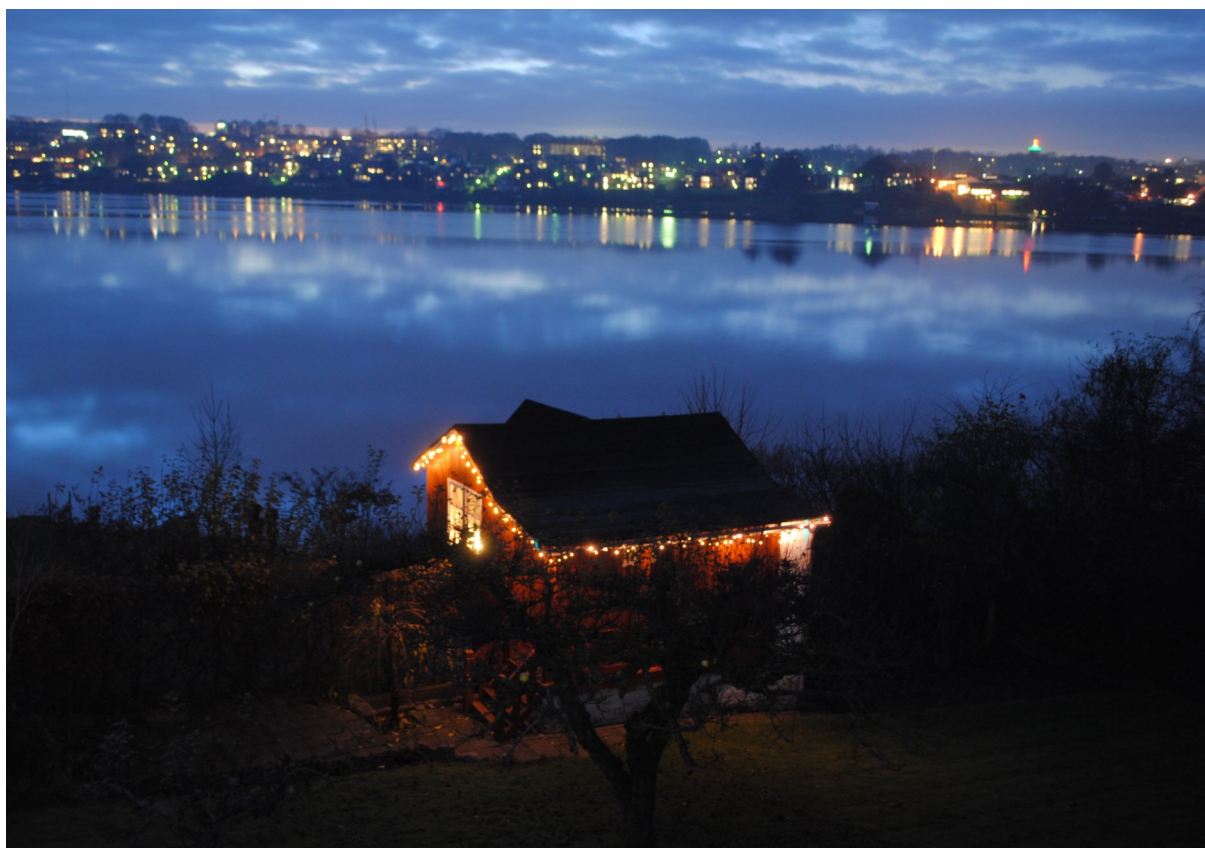
Julestemning i december fra Kommandobroen over Lysthuset og Nørresø