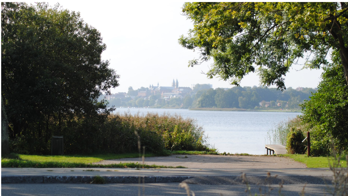
Sejlcenteret før anlæggelse af slæbested ved broen