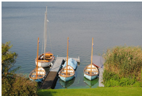
"Flådebasen" på Nørresøvej 11

Sejlcenter: Nørremøllevej 120 Flådebase: Nørresøvej 11 Magasin: Ungdomshuset