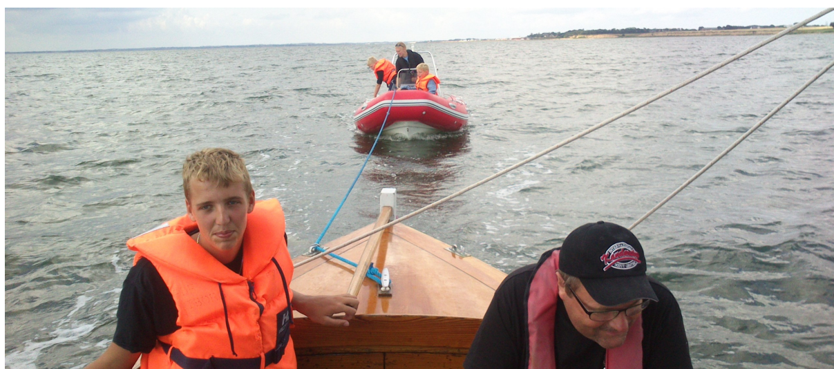
Ressource bevidste FDFere med Ørnen på slæb.