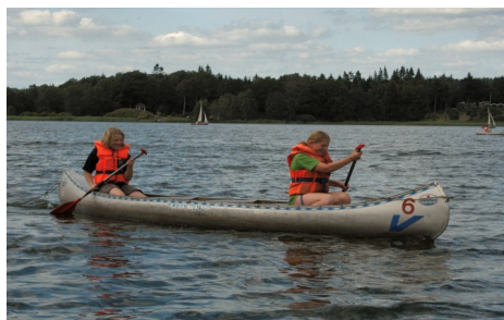
Kano nr. 6 på Julsø under en Landslejr

Farvande: Åer og søer Fartøjer: 14 kanoer Personer: Max. 42 (3x14) Mobilitet: 2 kanotrailere Flådebase: Nørremøllevej 120 / Kommencevej