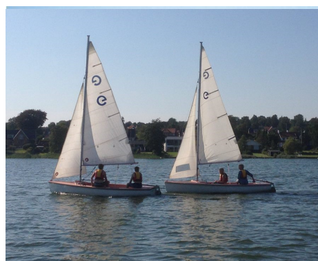
To columbusjoller på Nørresø.

Farvande: Søer, fjorde og kystnære områder. Fartøjer: Columbus joller: Hugin og Munin . Megin joller: Ella , Røskva , Tjalfe . Stor megin: Freja . Maxus 22: Balder . Personer: Max. 32 Mobilitet: Fem bådtrailere, Udstyr: Skipperkasser, Walkies, GPS m.v. Flådebase: Nørresøvej 11 indtil 1/10 2016. Nørremøllevej 120 herefter.