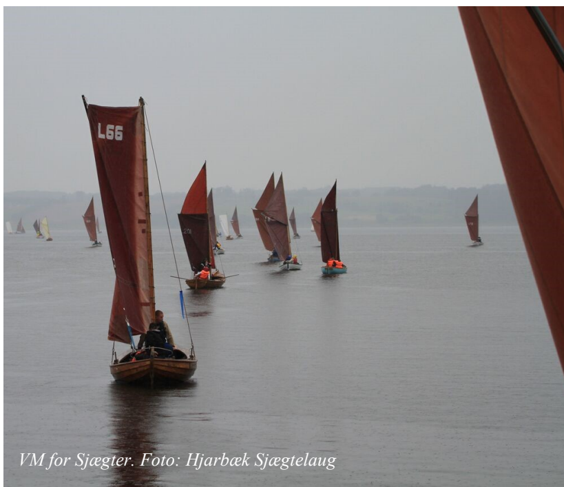
VM for Sjægter.