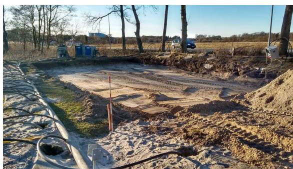
Udgravning til Sejlerhus begyndt