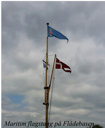
Maritim flagstang på Flådebasen

Kl. 17 - 19 mødte 14 pilte, to ledere og ca 7 forældre fra FDF Viborg 3. kreds ind for at gennemføre Matedor Mix Race. Alle meginjoller, stormegin og Ørnen deltog. Sol og skiftende vind fra Ø, 0-3 m/s.