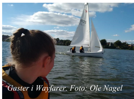
Gæster i Wayfarer.