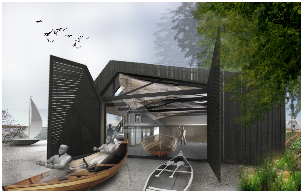
Skitse af det nye Sejlerhus østside. Modelfoto Stephan Gustin.

Nyt Sejlerhus og faciliteter på Sejlcenteret giver desuden muligheder for nye tiltag. Om muligt kan tænkes aldersopdelte gastehold, brug af Sejlcenteret til lejre for FDF kredse, mødevirksomhed for FDF kredse og andre m.m. Det er besluttet i bestyrelsen, at vi primært finder ud af eget behov frem til sommeren 2017 og herefter åbner op for andre.