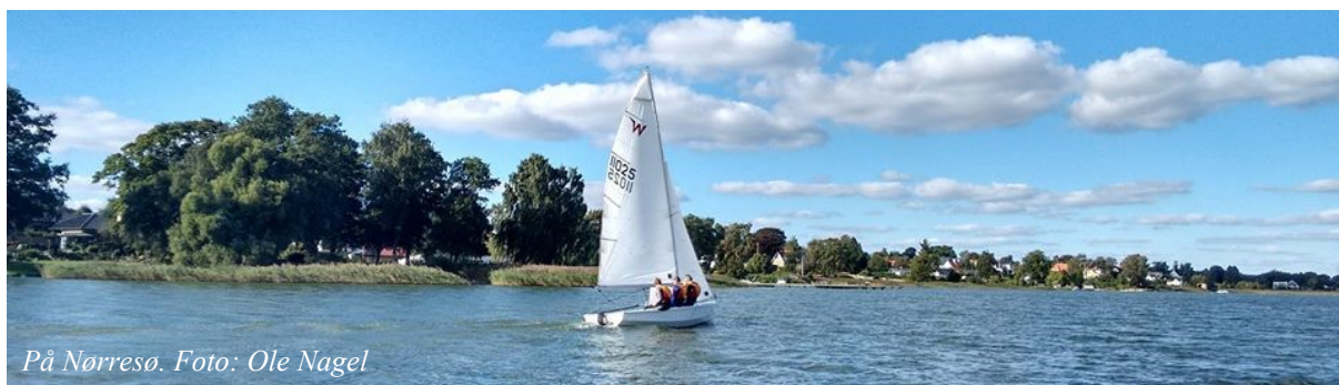
På Nørresø.