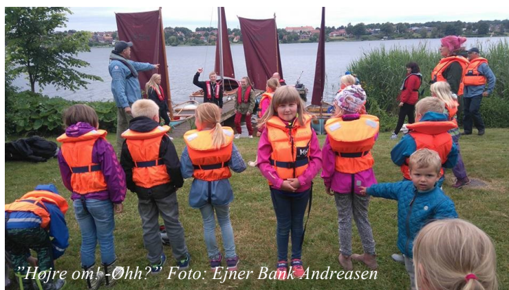
"Højre omb-Øhh?"