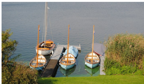
"Flådebasen" (nedlagt 2016)