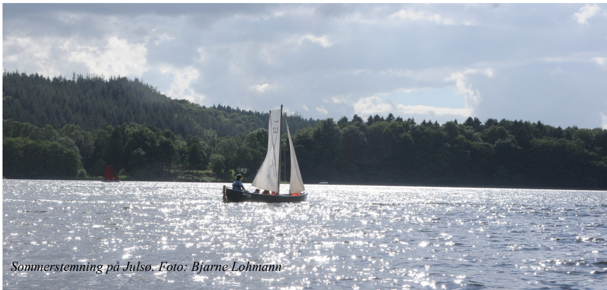
Sommerstemning på Julsø.