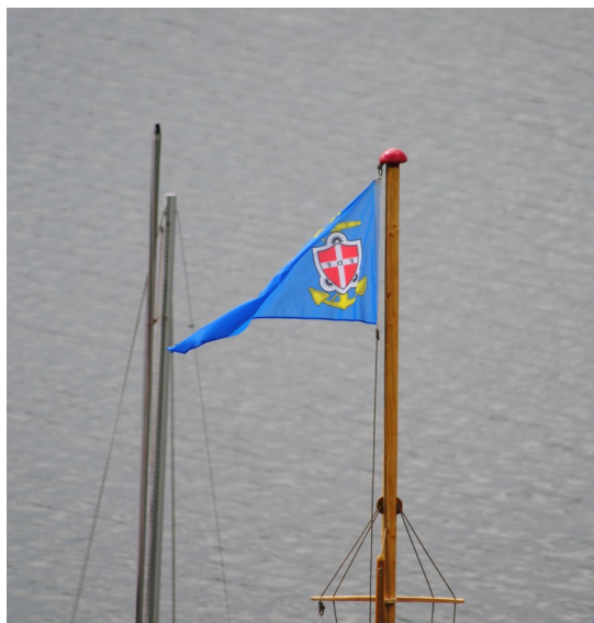
Den gamle sejlervimpel udgår til fordel for ny.