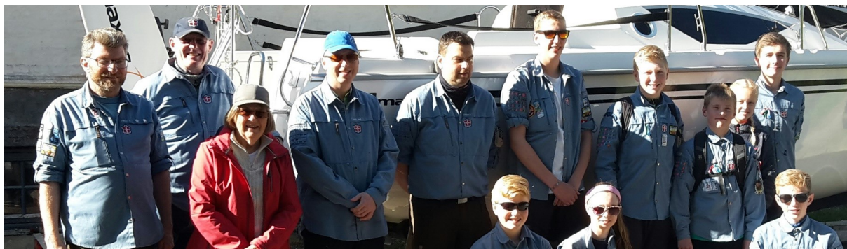
Deltagerne fra SCV ved afgang fra Viborg