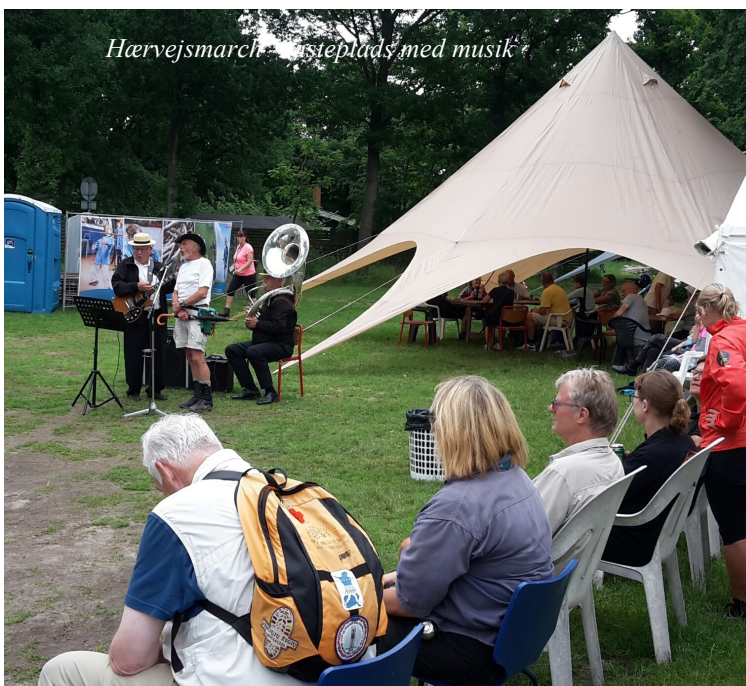
Hærvejsmarch - Rasteplads med musik