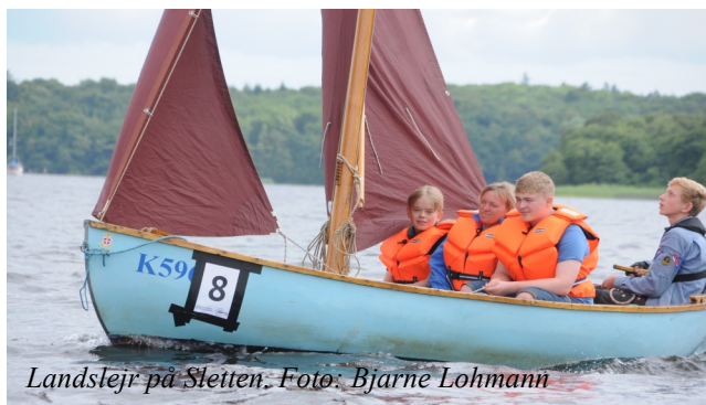
Landslejre på Sletten.

Røde caps til sejladsansvarlige, sorte til skippere, nye klub-vimpler, fælles agi-folder og plakater af dennes forside var forinden blevet fremstillet i et antal, så der var nok til brug på begge sejlcentrene SCL og SCV bagefter.