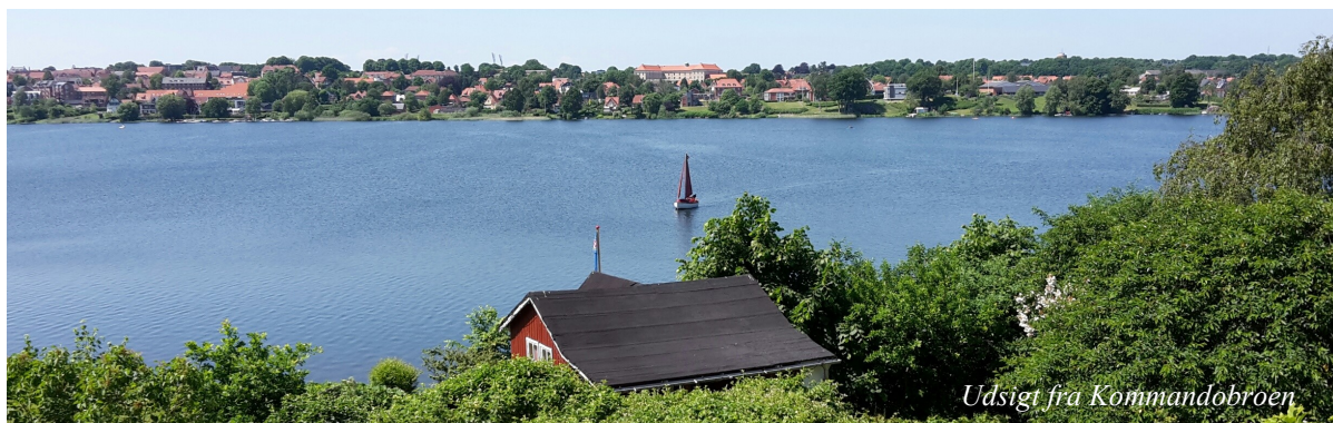
Udsigt fra Kommandobroen