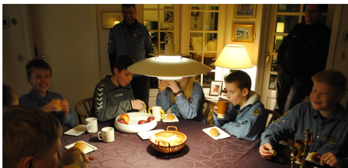
Teoriaften på Flådebasen