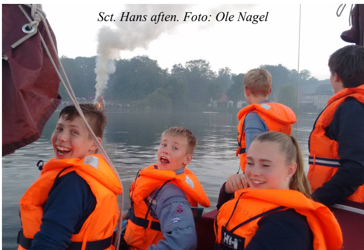
Sct. Hans aften.