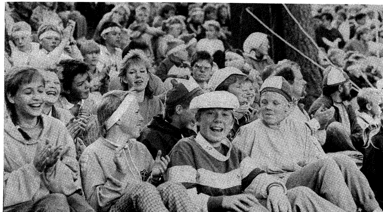
Et udsnit af det danske hold, der havde rød-hvide huer eller hvide pandebånd

Rejsen gik fra Göteborg tværs gennem Sverige til Kappelskär, hvorfra vi sejlede til Nådendal. Vel ankommen til Finland kørte vi 600 km nordpå i vor lejede bus. Godt trætte ankom vi hen under aften og blev modtaget af vore meget gæstfrie finske værter. Vi blev privat indkvarteret. Vi boede i Kajaani 3 dage, hvor der var arrangeret rundtur i byen, besøg på en papirfabrik og i forskellige ungdomsinstitutioner. En dag var vi på tur til Polarcirklen, hvor vi så byen Rovaniemi.