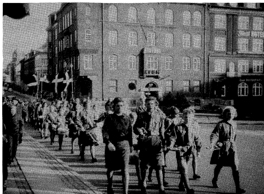
Billedet er fra marchen til Food-Fair-Hallen

Vi samledes med nogle store piger i Ferdinand Sørensens hjem 2 gange - sidste gang efter hans død. Vi skulle hejse flaget på halv og synge "Sov sødt, barnlille".