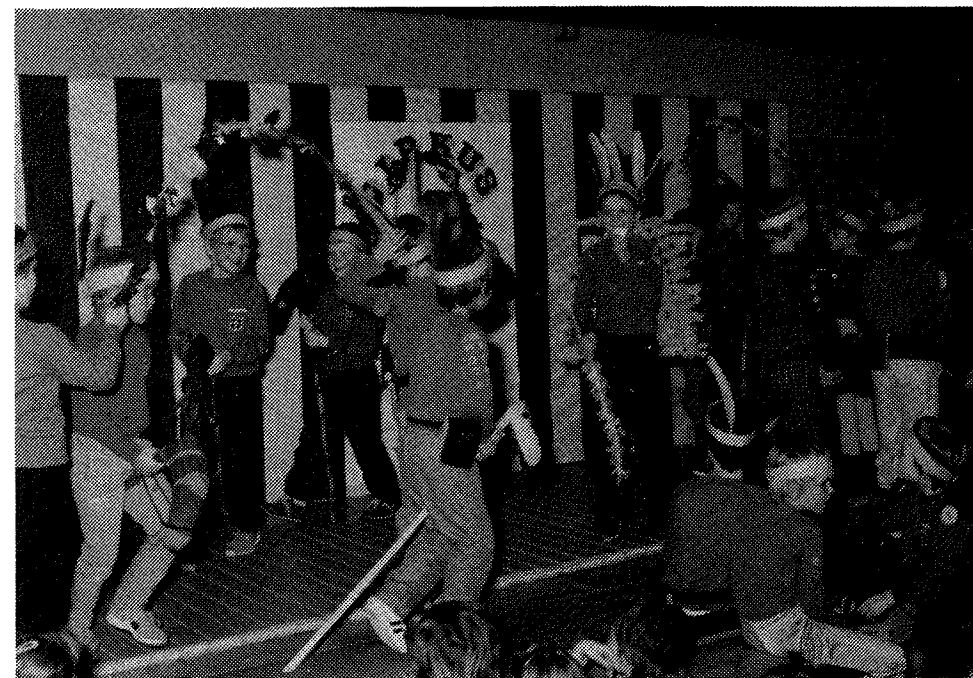
Fra Cirkus Buster's "hestedressur"

Forældrefesten er vel den aktivitet, der sammen med fødselsdagsfesten har den største berøringsflade til forældre, venner m.v.