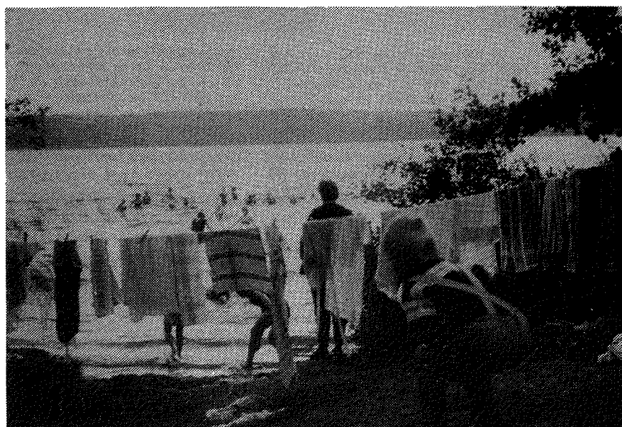
Det er rart med alle de piger, men det er nu rarest at have dem på afstand. (Badning i Madum Sø)