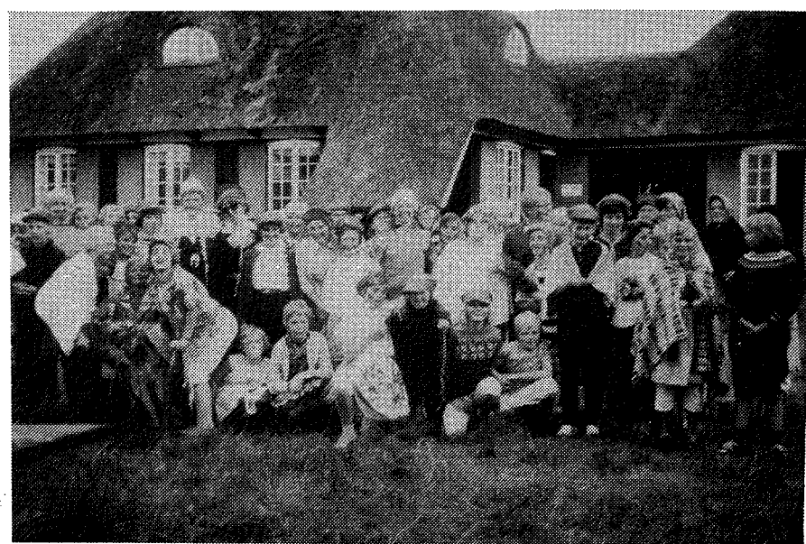
Billedet stammer fra Høstfesten på "Toften"