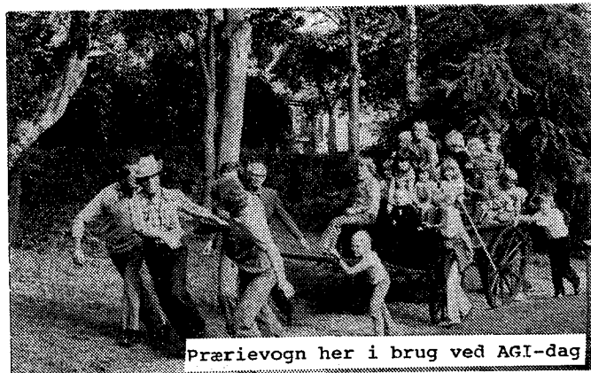
Prærievogn her i brug ved AGI-dag

Væbnerne her fra V.Ø.Hassing kreds er inviteret med som repræsentationshold fra FPF. Denne indbydelse har vi sagt ja til, og væbnerne er allerede gået igang med forberedelserne.